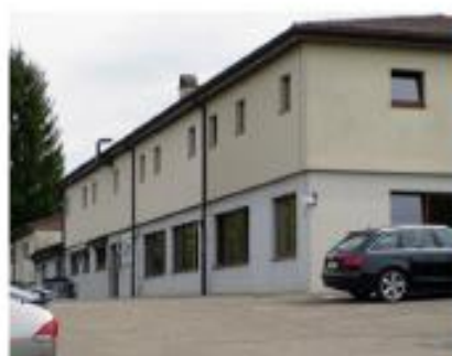
Ruhig und abgelegen