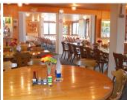
und Saal für 72 Personen