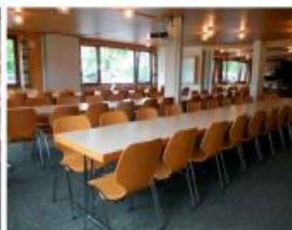
Saal als Konferenzraum mit Beamer

Von der Buslinie Nr. 68 Aesch – Ettingen – Flüh Haltestelle Schürhof nach ca. 150 m zu Fuss erreichbar. Parkplätze stehen in genügender Anzahl zur Verfügung.