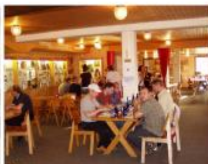
Schützenstube für 58 Personen